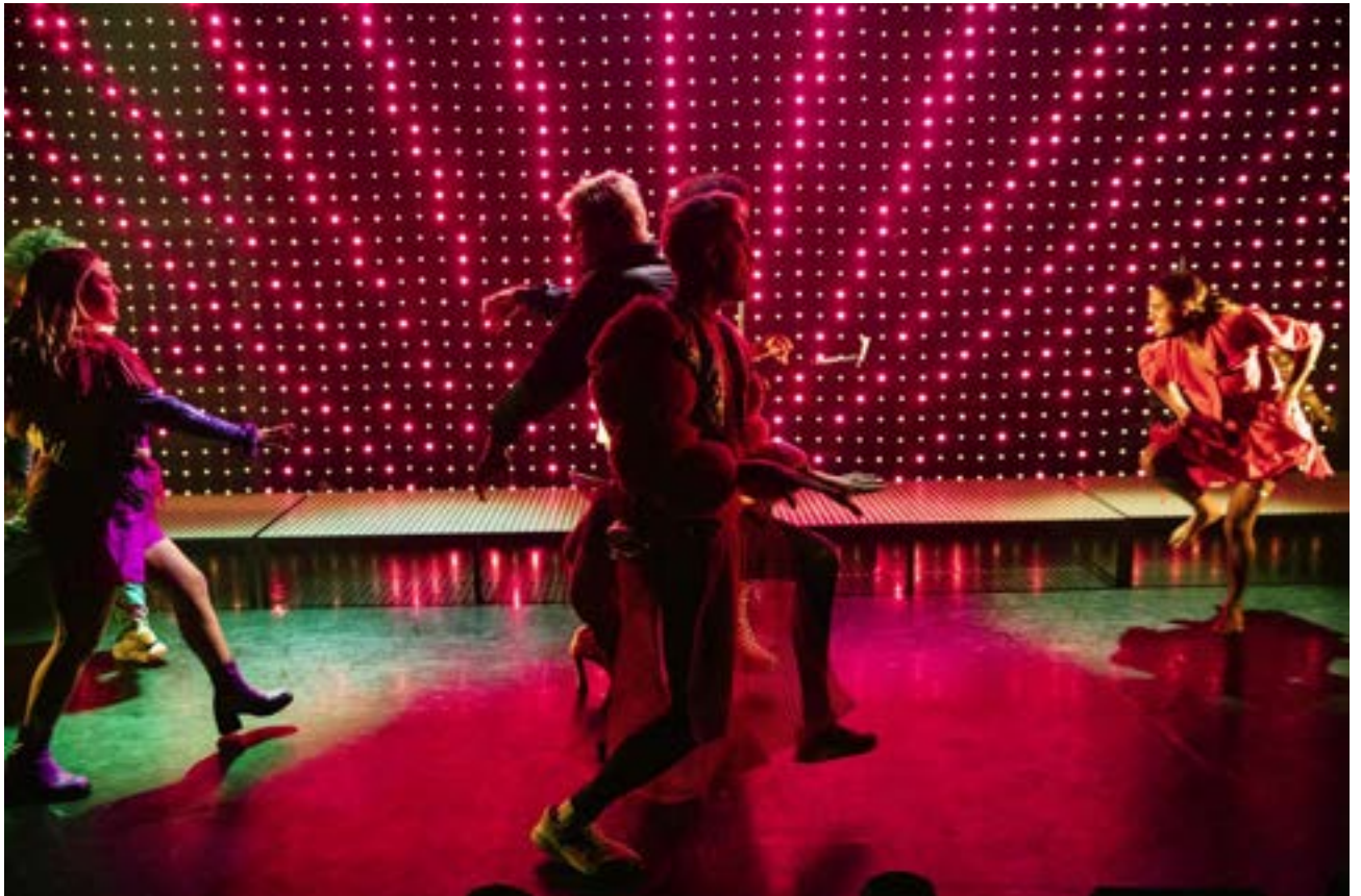
THE HOT PEACHES

"... ga dat zien, neem je vrienden mee, je tieners die op zoek zijn naar hun eigen identiteit en zeg tegen ze dat alles mag, alles kan en dat alles mogelijk is als je maar jezelf bent. educatie: