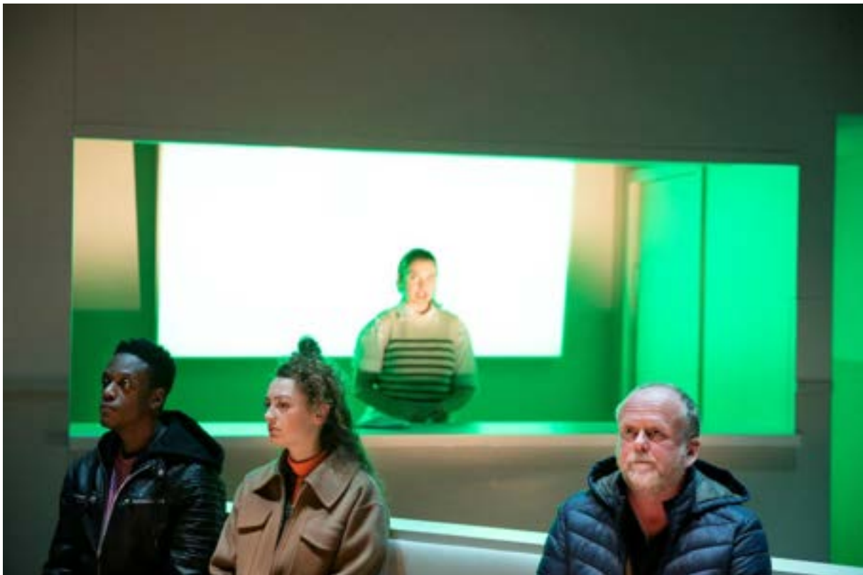
SNACKBAR