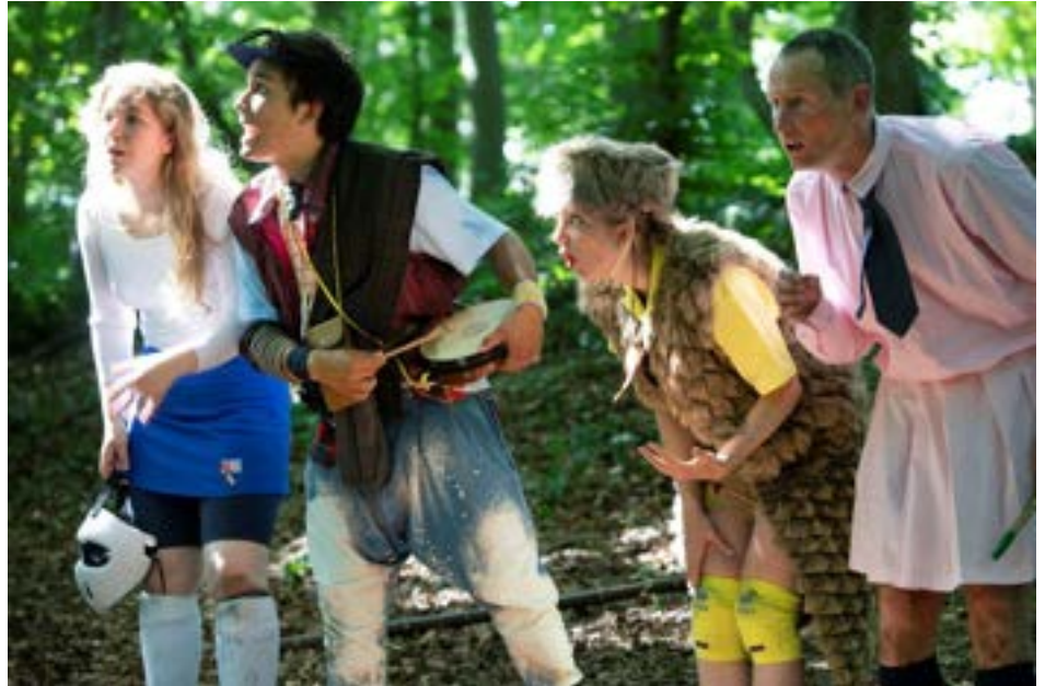
JAPANSE SPROOKJES