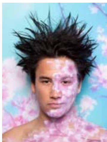
JAPANESE SPROOKJES © JAN HOEK