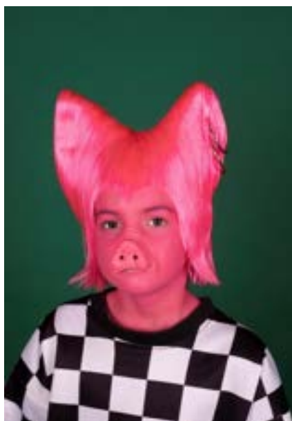
DE DRIE BIGGETJES EN HET WOLFSPAK © JAN HOEK