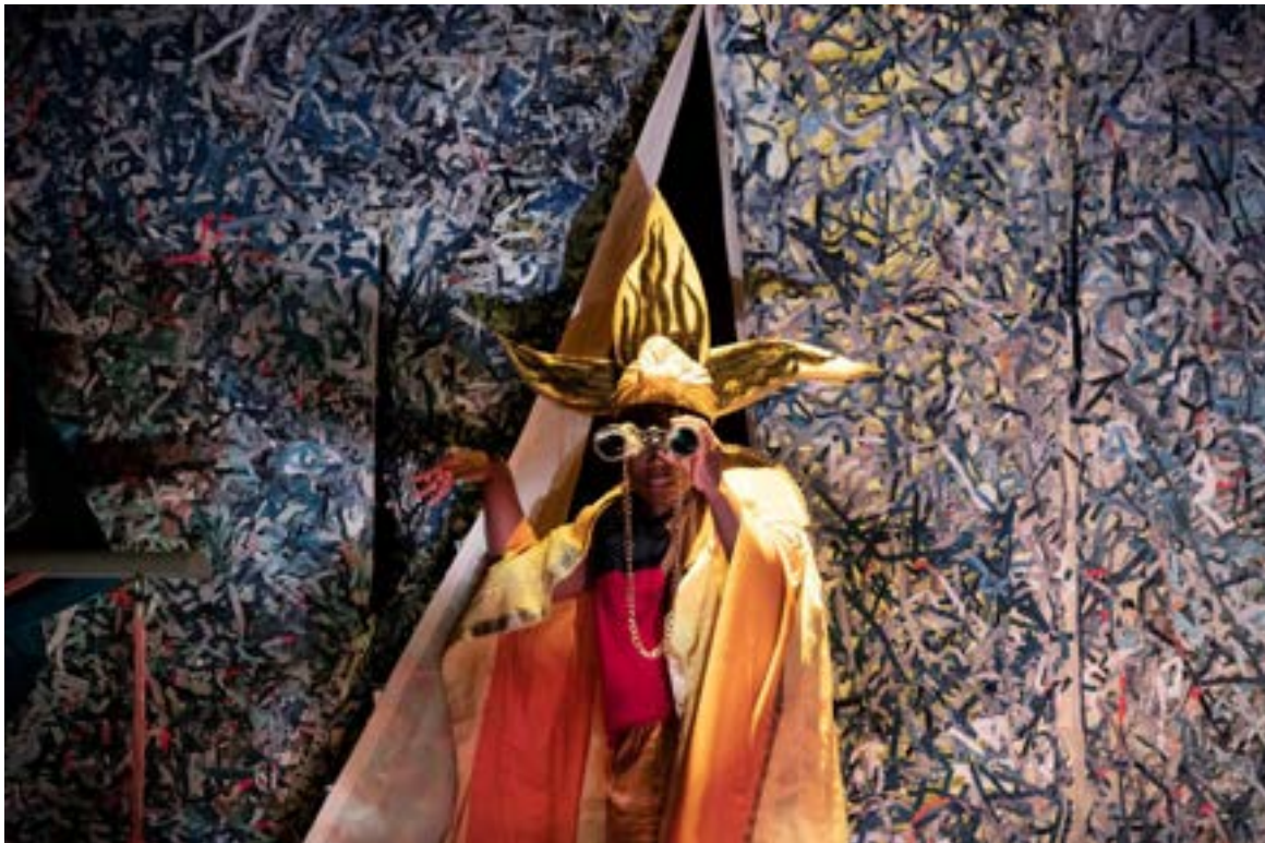
KIRIKOU EN KARABA DE TOVERHEKS © SANNE PEPPER

“een ode aan het vertelde verhaal, dat zich nooit in één definitieve vorm laat vastpinnen”