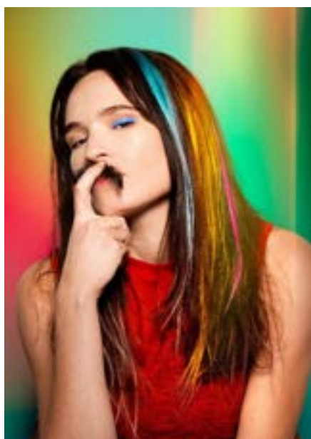
AS YOU LIKE IT