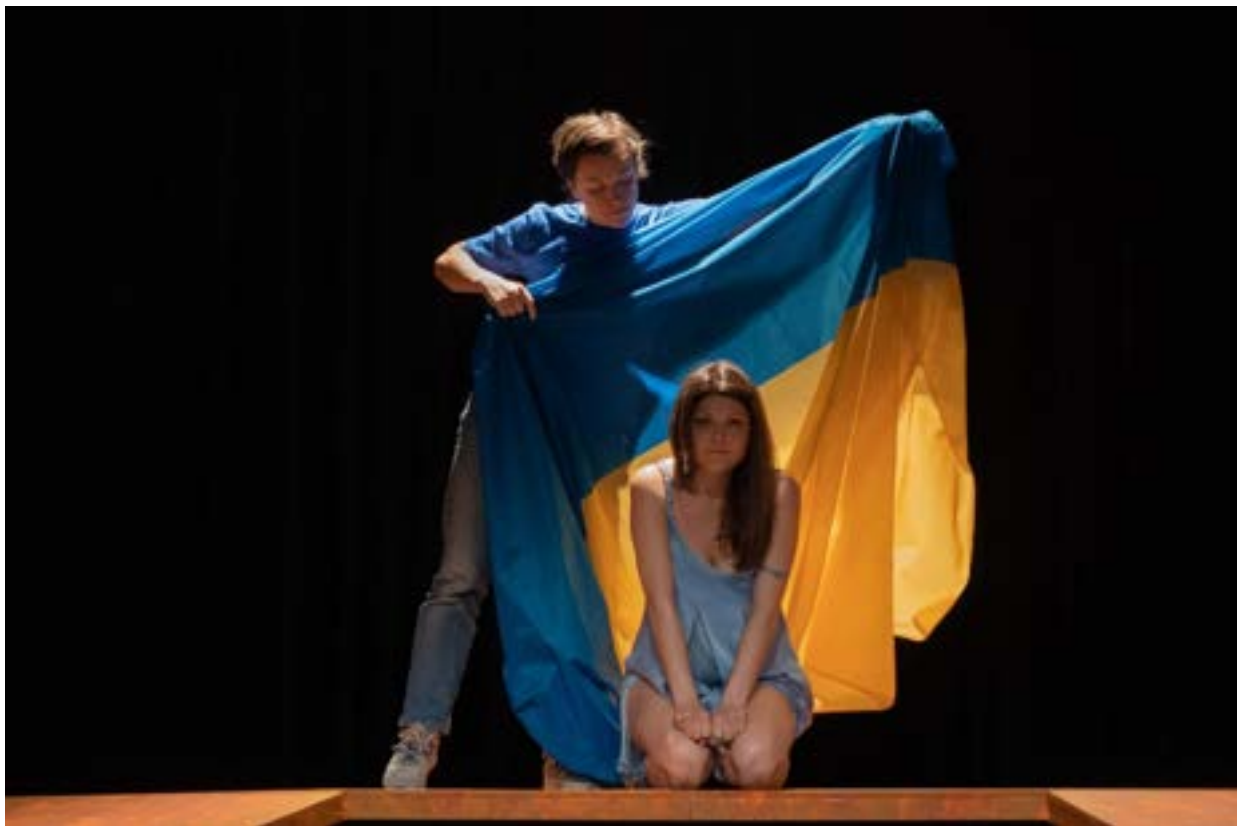
WITNESSING U

aantallen: eenmalig, in eigen huis, 77 bezoekers