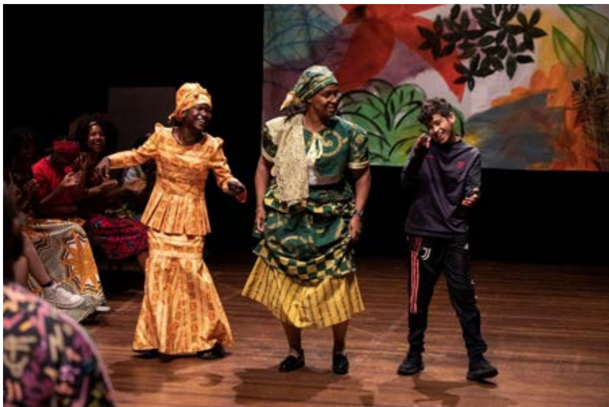
IN KLEUR

In kleur toont nieuwe perspectieven op de geschiedenis en geeft ruimte aan historische thema's die tot nu toe nog weinig aandacht kregen binnen het Nederlandse jeugdtheaterrepertoire. Dit nieuwe geluid resoneert bij een nieuw publiek en vult ons collectief geheugen aan zodat de geschiedenis verder voortleeft.