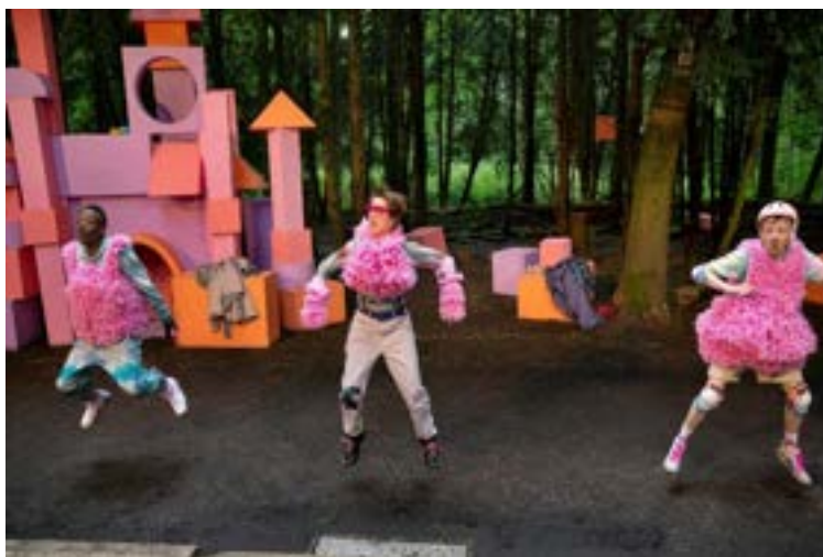
DE DRIE BIGGETJES EN HET WOLFSPAK

"een coming-of-age verhaal vol humor, pakkende liedjes en een verrassende moraal"