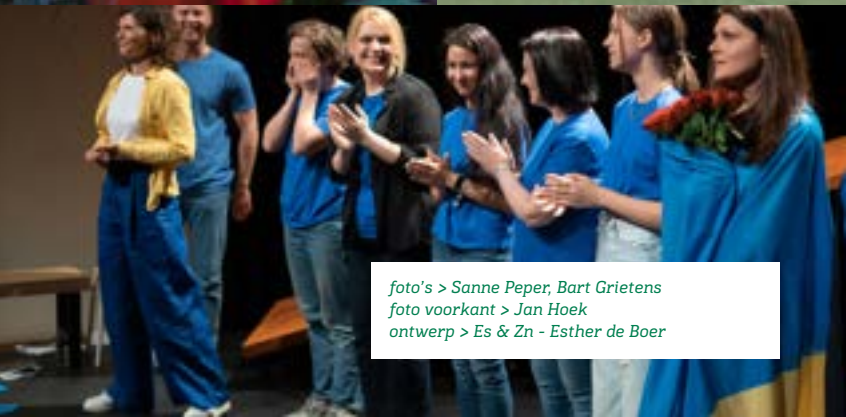
ontwerp > Es & Zn - Esther de Boer