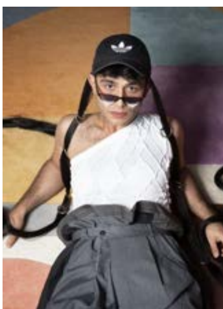
THE HOT PEACHES