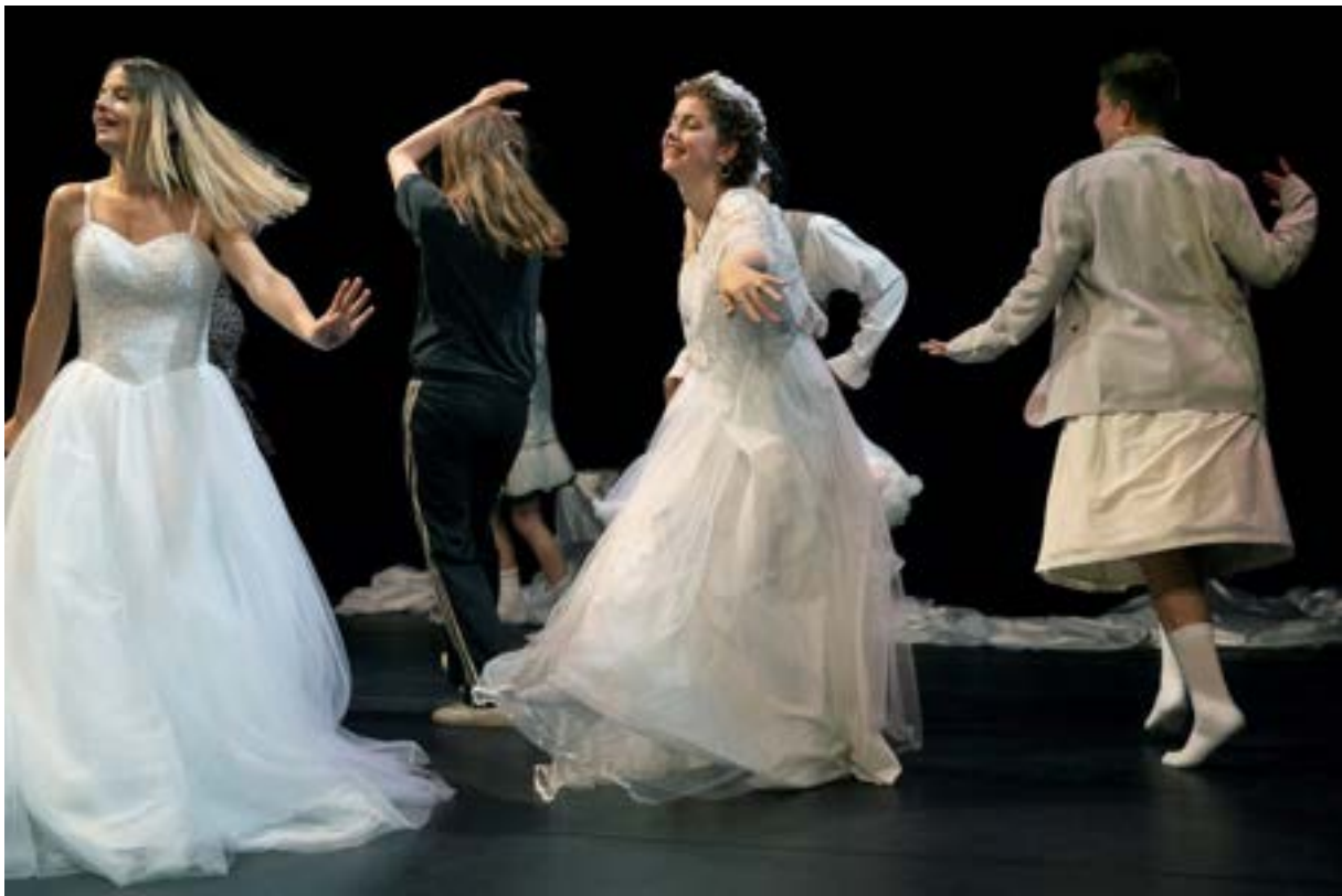
YOUP REFORM

Na twee jaar uitstel vanwege Corona konden we eindelijk aan de slag met YouPerform, een internationaal jongerenproject waarin we jongeren in een aantal weken begeleiden om hun eigen verhaal middels een performance 'on stage' te brengen. Vervolgens pakten we onze koffers om naar Hamburg af te reizen en daar in het Thalia Theater hun performance te laten zien aan een internationaal publiek, jongeren uit Frankrijk, Servië, Duitsland en Boedapest. Deze jongeren laten ook allemaal hun eigen performances zien. Daarna werden de groepen uit de verschillende landen gemengd en werkten ze in gemixte samenstellingen aan nieuwe performances.