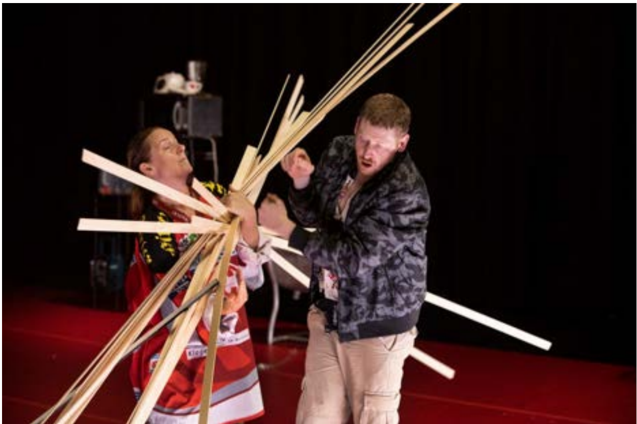
DE STOKJESMAN