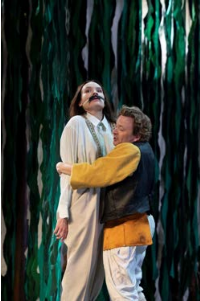
AS YOY LIKE IT © SANNE PEPPER

“mama ze is slim ze is sterk en ze is slim en ze helpt me