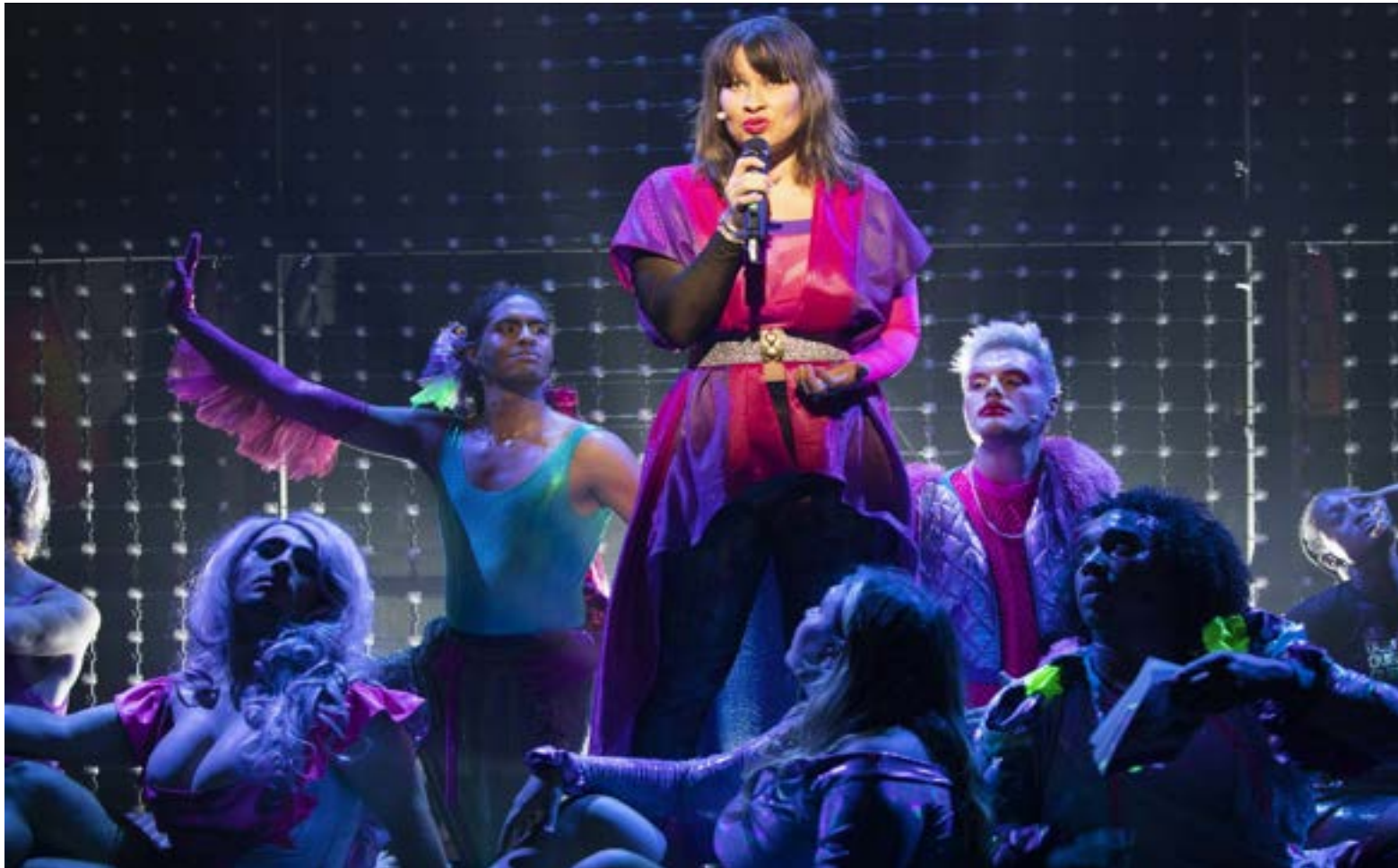
The Hot Peaches