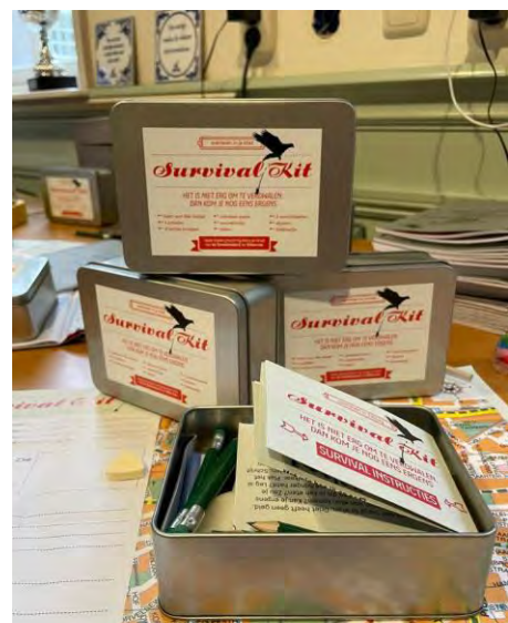
SURVIVALKIT HANS EN GRIET

dwaalde het publiek net als Griet door straten en stegen en ontdekte ondertussen van alles over de stad en zichzelf. De Survival Kit werd per stad op maat gemaakt. De bezoekers liepen allemaal hun eigen route, iedereen gaf een eigen invulling aan zijn tocht. De te volgen weg hing af van keuzes die de bezoekers onderweg maakten.