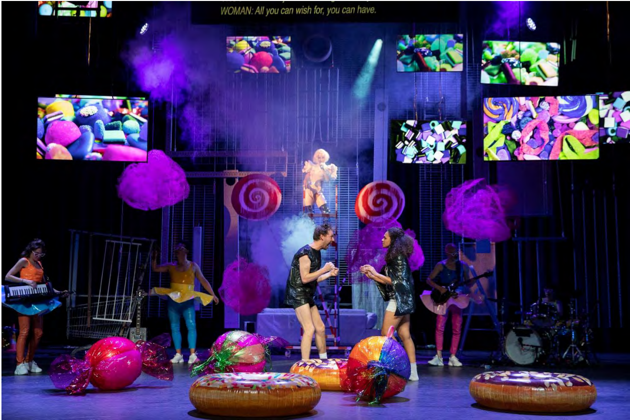
HANS EN GRIET © SANNE PEPPER