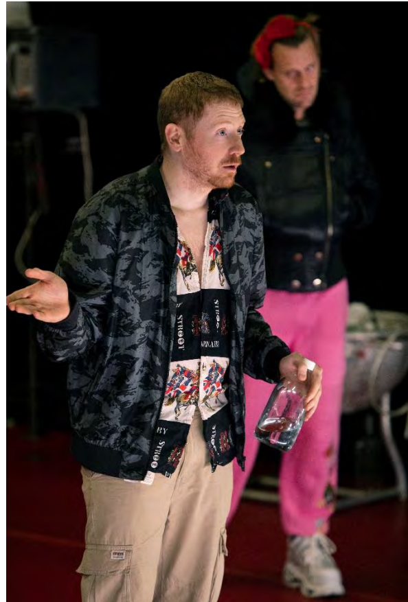
DE STOKJESMAN

Theaterwetenschappen UVA Bachelors (2x) en master internationale dramaturgie UVA.