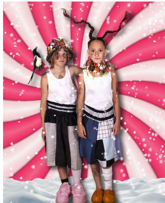
HANS EN GRIET © JAN HOEK