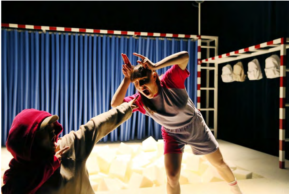
MEISJES PAKKEN DE JONGENS