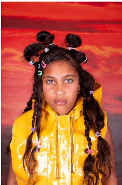
MEISJES PAKKEN DE JONGENS