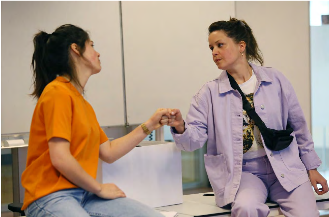
SWEET SIXTEEN