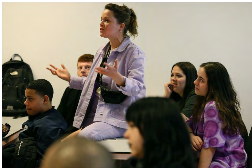
SWEET SIXTEEN