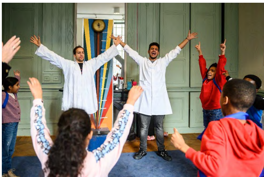
PROJECT IN HUIS: MEISJES PAKKEN DE JONGENS

Ook al is ons schoolpubliek een afspiegeling van de maatschappij en daarmee net zo divers, we besteden toch altijd nog net wat meer aandacht aan scholen waarvan de leerlingen zelf niet of nauwelijks in aanraking komen met theater. In 2021 boden we via negen theaters, waar we een schoolvoorstelling van Hans en Griet zouden spelen, het project #ikbengriet aan. Doel was om de kinderen en hun docenten te trakteren op een verbredende, verdiepende en vooral onvergetelijke projectdag. Leerlingen dompelden zich één dag onder in de opera en maakten samen #ikbengriet: een schoolpleinopera 2.0 waarbij spoken word , dans en opera naadloos in elkaar overvloeien. Helaas konden uiteindelijk slechts drie scholen van dit aanbod gebruik maken omdat corona wederom roet in het eten gooide. De deelnemende scholen waren erg positief. Ze gaven aan hun leerlingen op een andere manier te zien, leerden veel over hun klas en vonden dit ongelofelijk waardevol.