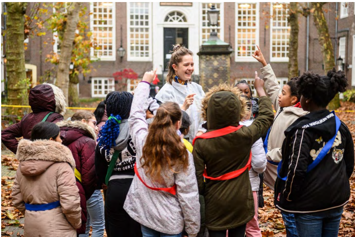
PROJECT IN HUIS: MEISJES PAKKEN DE JONGENS

We hebben dit jaar met het ontwerpen van ons voorbereidend materiaal ingezet op duurzaamheid. We zorgden ervoor dat onze lespakketten zowel met als zonder voorstellingsbezoek interessant waren voor leerlingen. Scholen konden zo het lesmateriaal ook gebruiken als de voorstelling gecanceld was door lockdown of quarantaine verplichtingen.