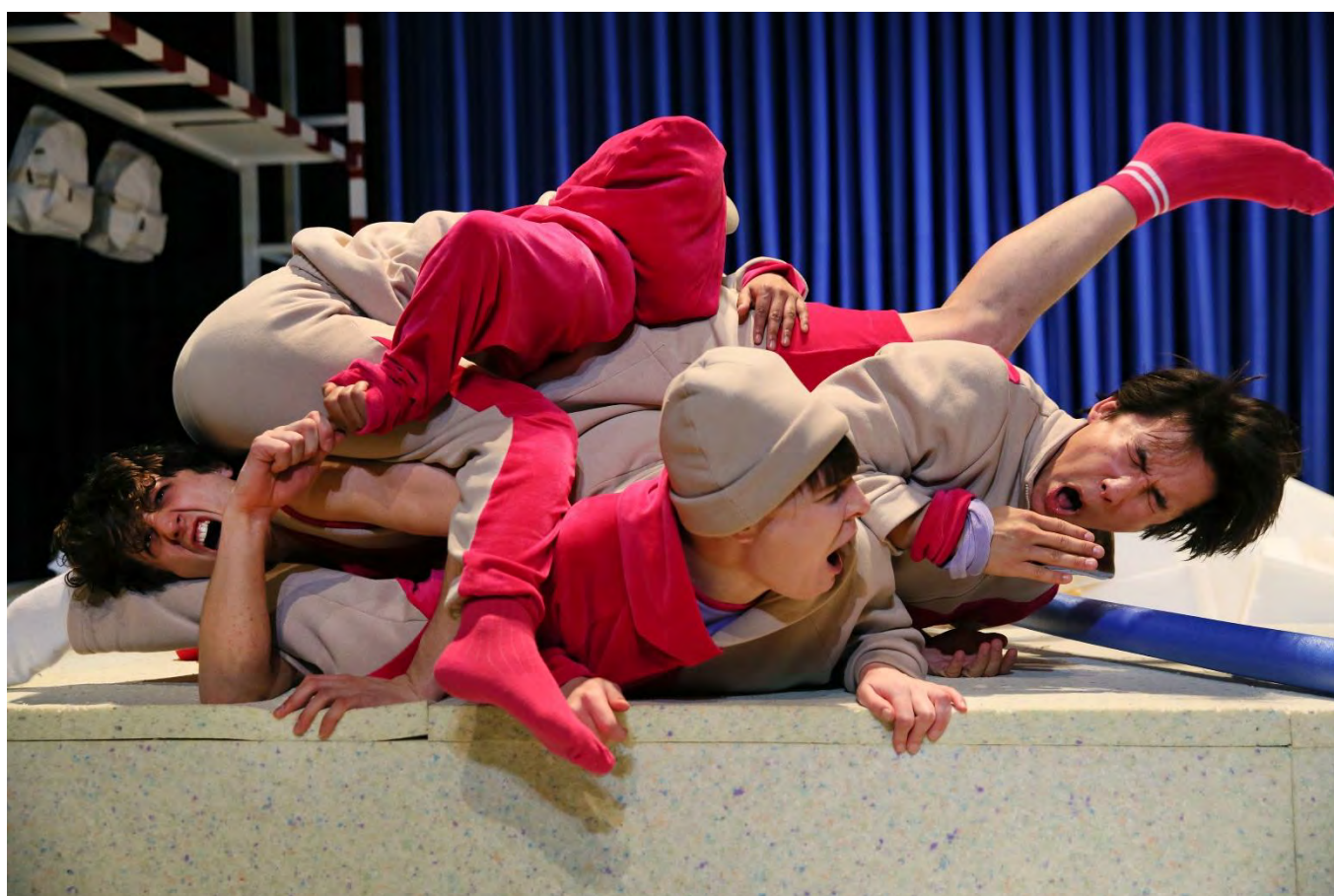
MEISJES PAKKEN DE JONGENS