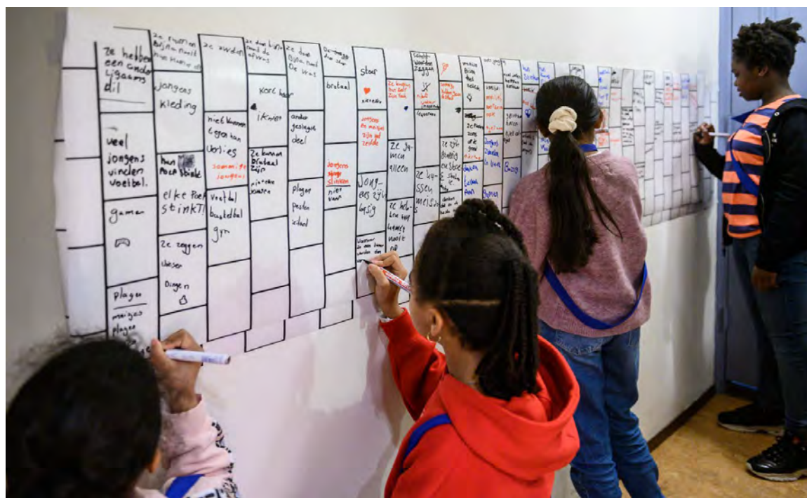
MEISJES PAKKEN DE JONGENS PROJECT IN HUIS © BART GRIETENS