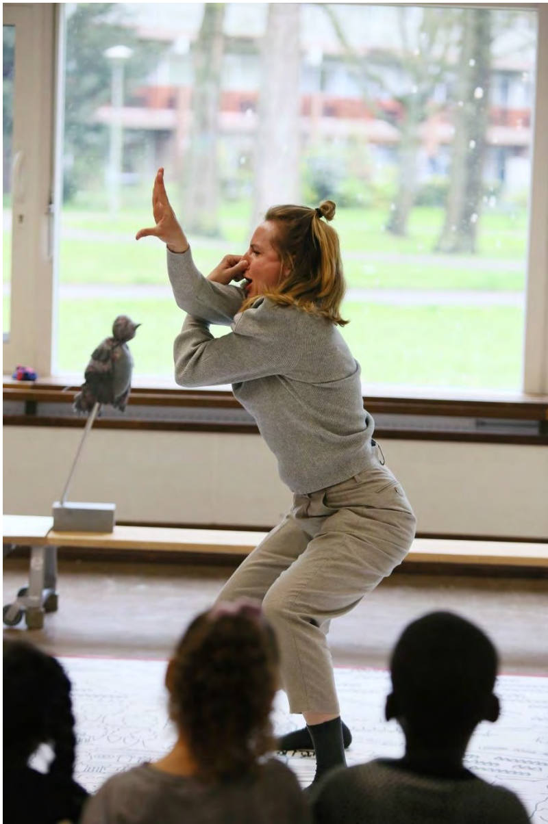
EEN KLEINE BRIEF AAN DE GROTE STAD © SANNE PEPPER

Met de droomveer in hun handen en de ogen dicht geknepen bedenken ze waar zij heen zouden willen gaan, als ze konden vliegen. Met krijtjes teken ze een hartje op grond bij hun favoriete plek in de buurt. En de kaart is voor een heel speciaal persoon. Het hart van de stad kan ook iemand zijn.