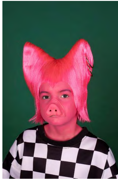
DE DRIE BIGGETJES EN HET WOLFSPAK © JAN HOEK