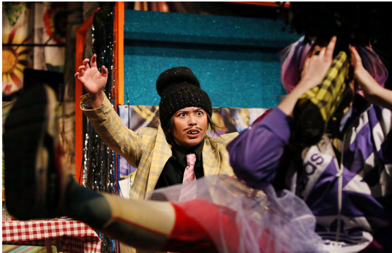
POPPENKAST © SANNE PEPPER