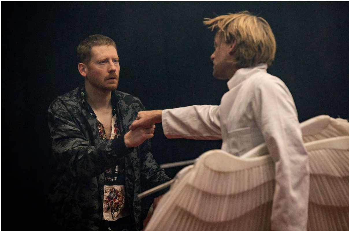
DE STOKJESMAN © SANNE PEPER

De Stokjesman kwam voort uit het schrijftraject Onder Twaalf waar Tomer Pawlicki aan deelnam. In coproductie met theatercollectief Dood Paard heeft de Toneelmakerij de