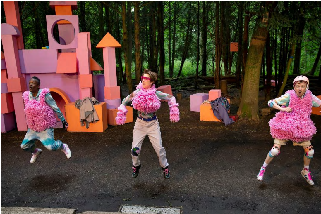
DE DRIE BIGGETJES EN HET WOLFSPAK © SANNE PEPPER