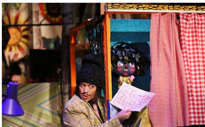
POPPENKAST