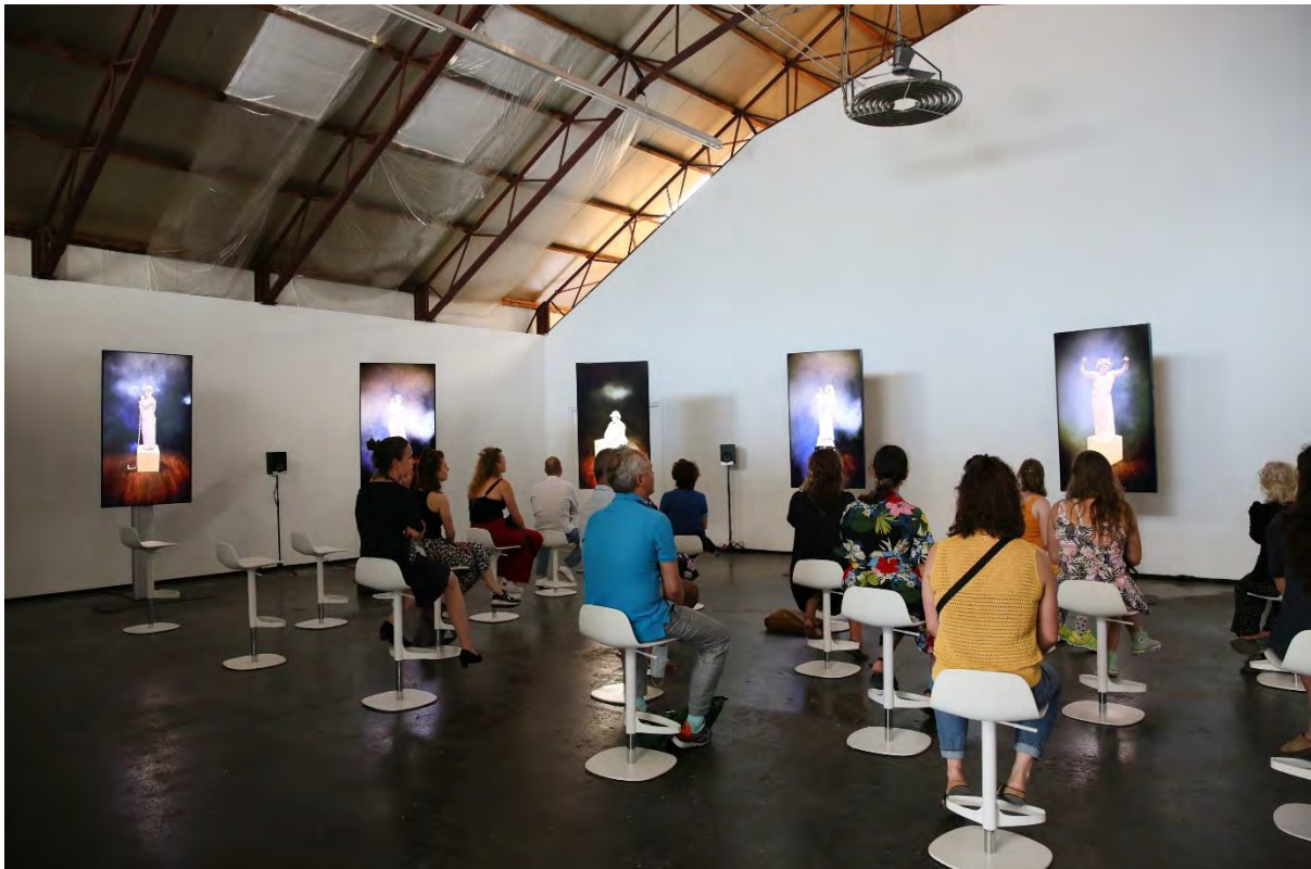
UNTITLED © SANNE PEPER

Untitled onderzoekt hoe we nu en door de tijd heen kijken naar mensen met een verstandelijke beperking. Van halfgod tot duivelskind, clown, knuffelbeer of creatief genie. Woorden bepalen hoe we kijken én wat we zien. Kan je naar iemand met Down kijken zonder het woord 'Down' in je hoofd? Uiteindelijk ging Nederland vlak voor de première weer open en konden de spelers live in de installatie spelen. We onderzoeken nu of de installatie in FOAM tentoongesteld kan worden.