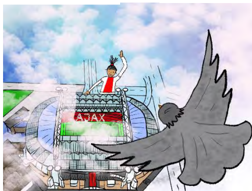
EEN KLEINE BRIEF AAN DE GROTE STAD © ANNE FÉ DE BOER