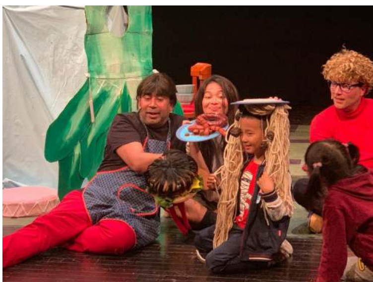
EET JE BORD LEEG BEIJING