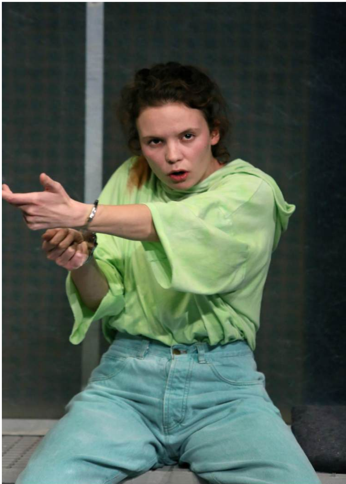
Age of rage