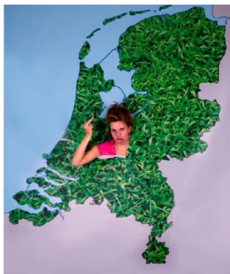
AGE OF RAGE