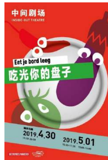
POSTER EET JE BORD LEEG CHINA