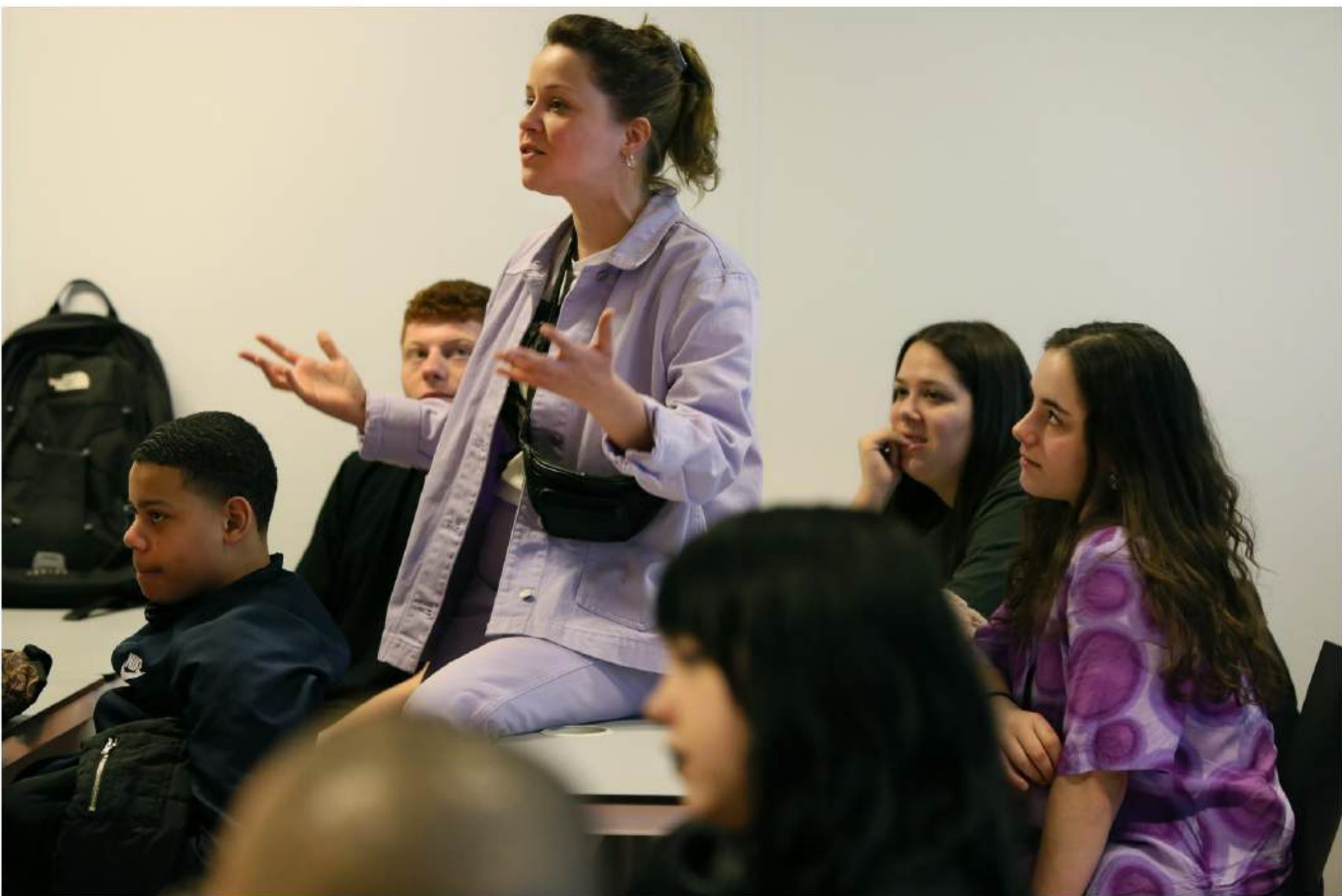
SWEET SIXTEEN