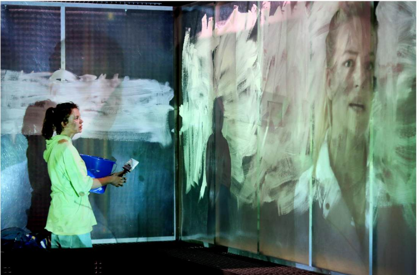
AGE OF RAGE © SANNE PEPPER