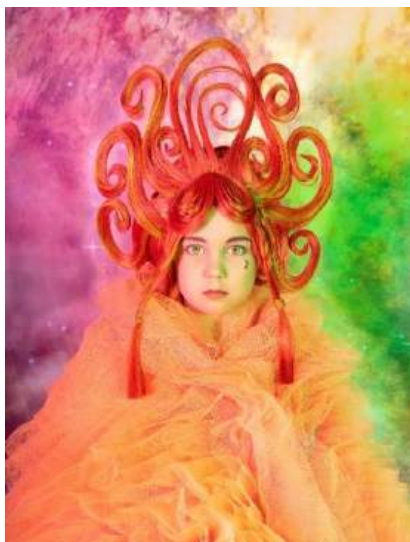
DE TOVERFLUIT