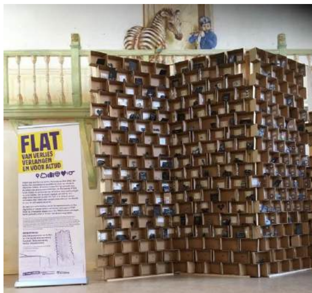
EDUCATIEMATERIAAL PAVEMENTS OF GOLD

Alle appartementen samen, vormen een flatgebouw. Van buiten zien alle ruimtes er hetzelfde uit, maar van binnen is elk appartement anders. In het midden staan silhouetten van iets dat de leerlingen verloren zijn. Aan de muren, ingelijst, dat wat ze voor altijd willen bewaren. En door het raam is er uitzicht op hun verlangens. De bouw van de flat is in ontwikkeling, net als Amsterdam Zuidoost. Elke dag komen er nieuwe ruimtes bij. Meer dan duizend kinderen maakten een appartement, waar het vrije publiek naar binnen kon kijken.