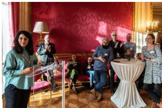
ETC CONFERENTIE