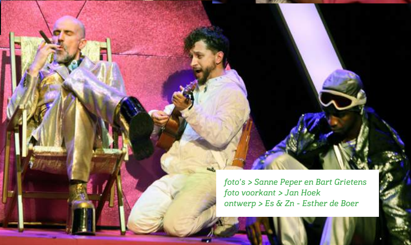
ontwerp > Es & Zn - Esther de Boer