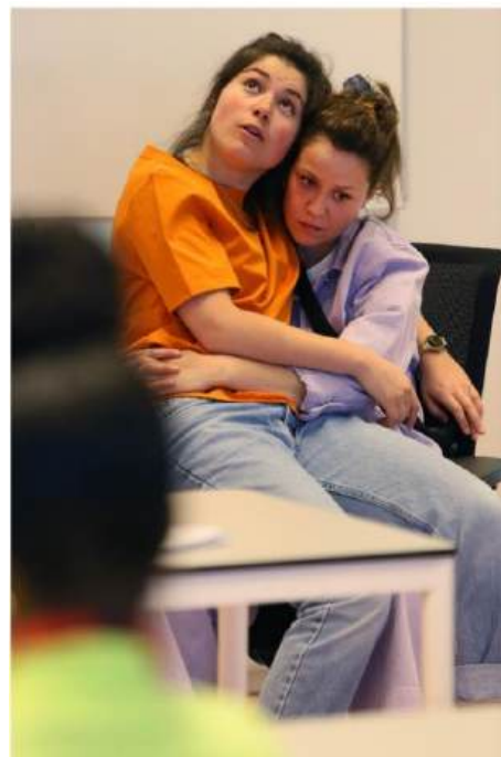
SWEET SIXTEEN