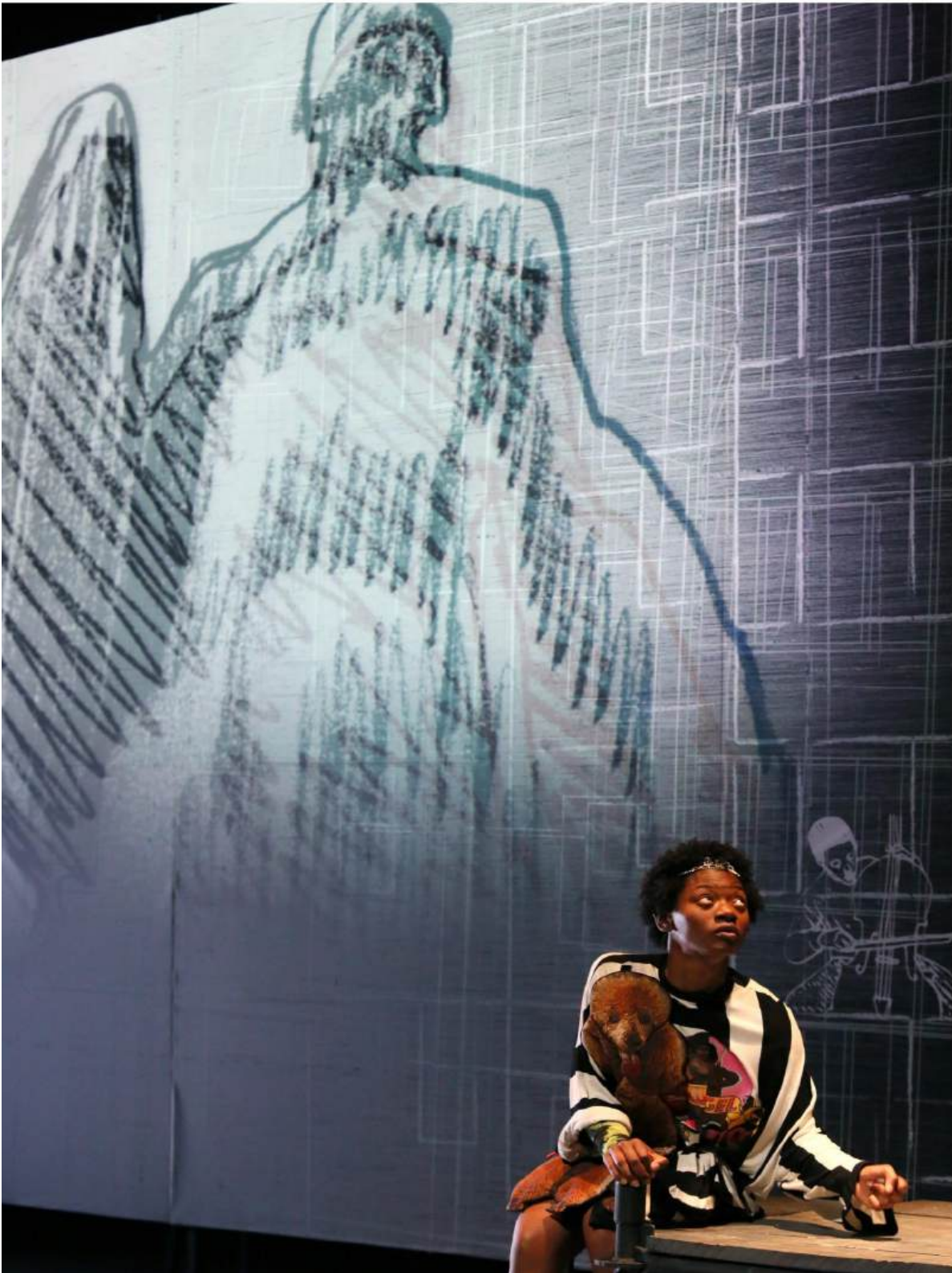
Pavements of Gold