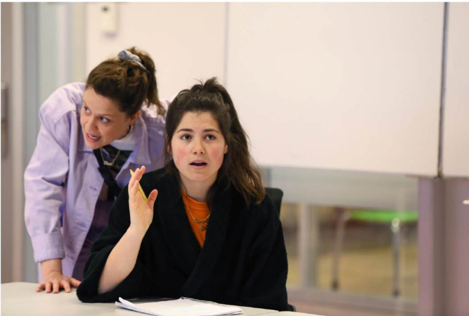
SWEET SIXTEEN © SANNE PEPER