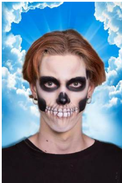
SWEET SIXTEEN