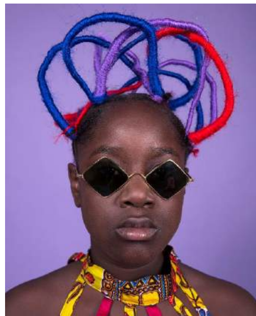
PAVEMENTS OF GOLD