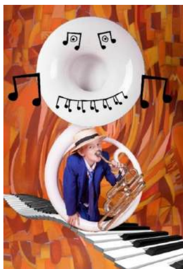
JAZZ DUZZ 1