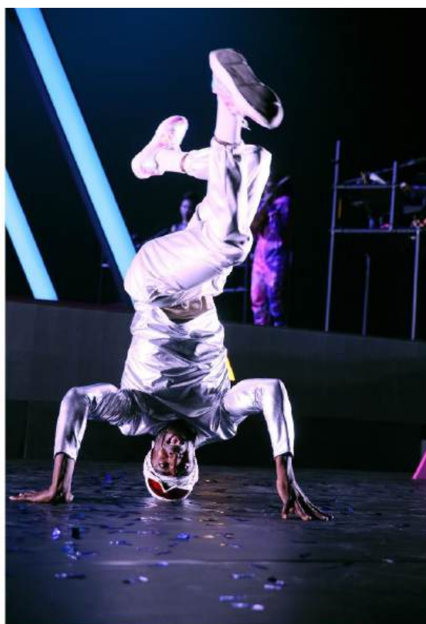
DE TOVERFLUIT