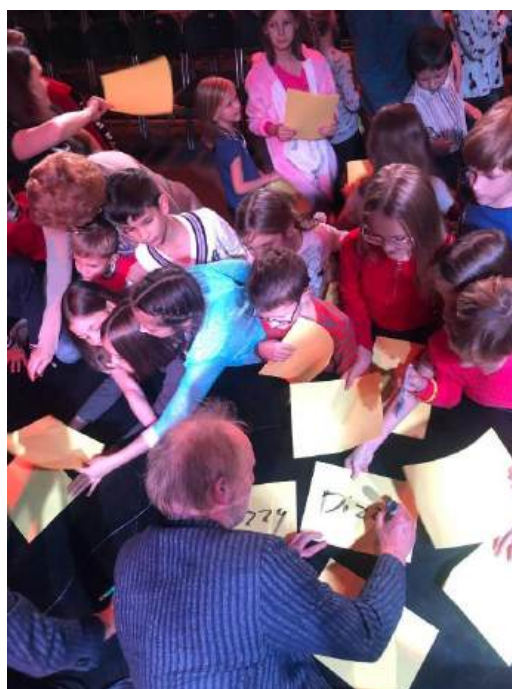
JAZZ DUZZ MOSKOU